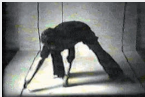
Geta Bratescu, The Studio (1978), film super 8 noir et blanc, silencieux, 17 min 42